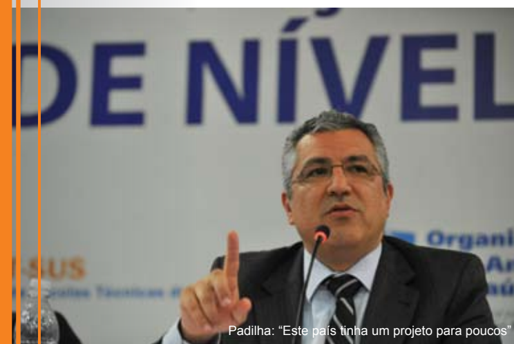
Padilha: “Este país tinha um projeto para poucos”

Ainda de acordo com o ministro, para enfrentar os impasses de consolidação do Sistema Único e cumprir o lema de sua gestão, o trabalhador de nível médio será fundamental, assim como afastar as ideias preconcebidas sobre essa formação. “Não cabe mais a visão preconceituosa, que por muito tempo se perpetuou, de apostar na formação do nível médio porque é mais barato, mais rápido, mais fácil”, reforçou, acrescentando: “Vamos formar porque para a realidade do hospital, das unidades de saúde, da prevenção, é fundamental o conjunto de habilidades e competências do profissional de nível médio”.