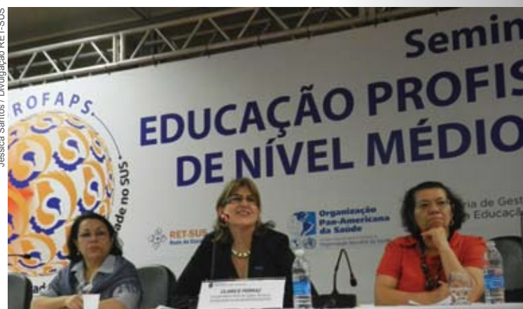
Encerramento do seminário trouxe perspectivas para escolas se integrem às políticas de educação profissional do SUS

A faixa etária dos estudantes das instituições pesquisadas varia entre 14 e 40 anos. A maioria não é trabalhador da área da saúde, o que caracteriza a chamada 'demanda aberta'. No que se refere ao corpo docente das instituições, há recorrência de bacharéis em Letras, Geografia, História, Economia, Ciências da Computação e Serviço Social dentre os cursos fora da área da saúde. Também é comum encontrar docentes