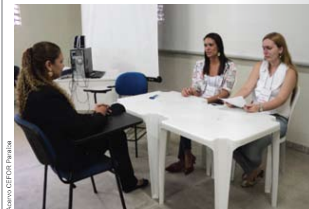
Acesso CEFOR Paraíba

O curso Técnico em Vigilância em Saúde, que irá formar 400 trabalhadores do Sistema Único de Saúde, tem previsão para começar no final de setembro.