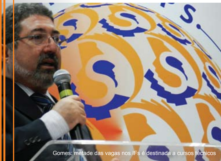
Gomes: metade das vagas nos IFs é destinada a cursos técnicos

dente Nilo Peçanha criou escolas de aprendizes e artífices. A ideia vigente na época era de que o ensino profissionalizante deveria atender à população 'desassistida pela fortuna', como está escrito no decreto de criação da rede", afirmou.