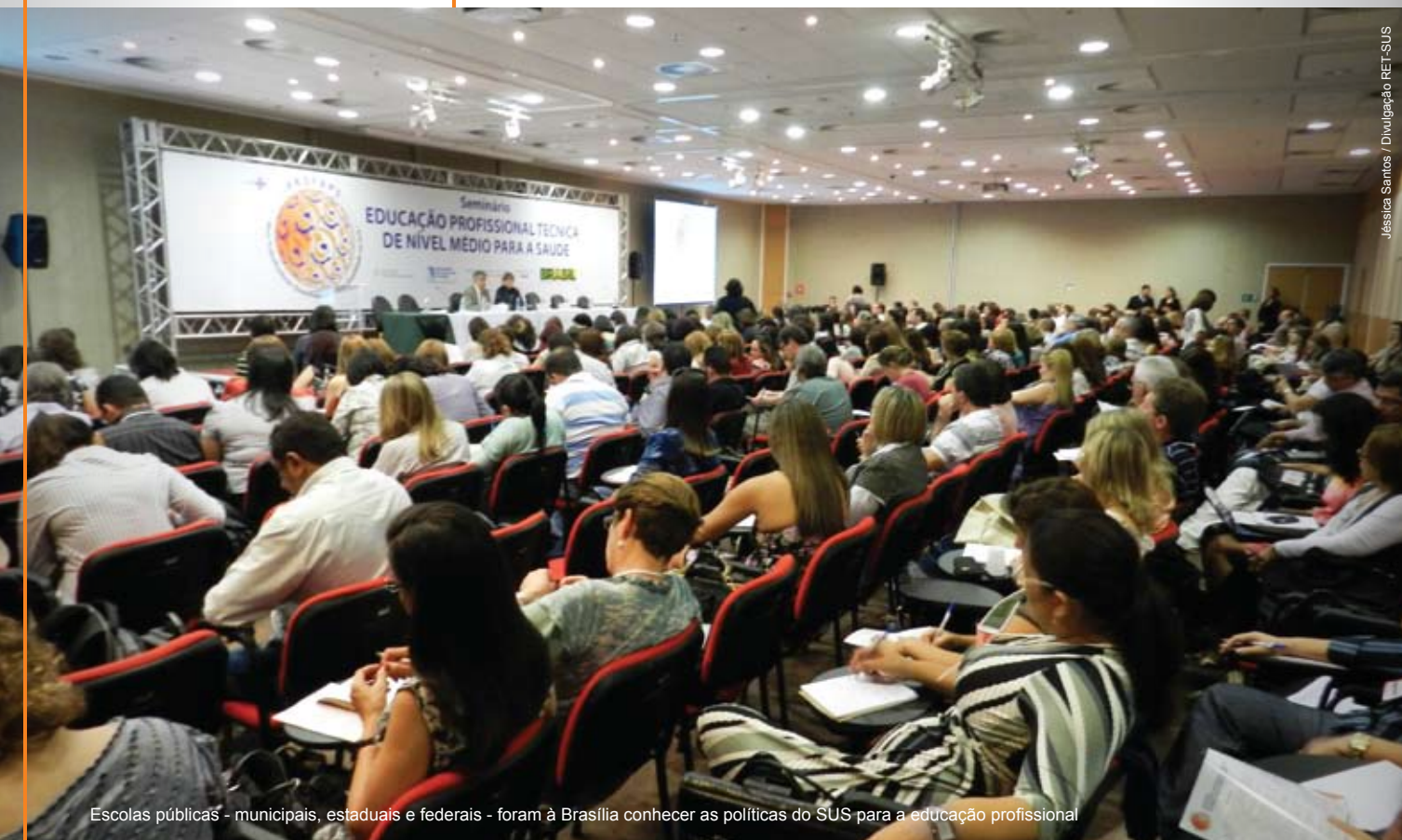
Escolas públicas - municipais, estaduais e federais - foram à Brasília conhecer as políticas do SUS para a educação profissional

Estima-se que dos 2,2 milhões de profissionais atuando em estabelecimentos de saúde no país, 1,2 milhão ocupem postos de trabalho de nível médio. Segundo dados da última Pesquisa de Assistência Médico-Sanitária (AMS), do IBGE, que mapeia serviços públicos e privados, são 889.630 postos ocupados por auxiliares e técnicos. No entanto, a pesquisa não considera os 245 mil agentes comunitários de saúde atuando na Estratégia de Saúde da Família, dentre outros profissionais, como os agentes de combate às endemias, o que corrobora as estimativas de que 60% da força de trabalho em saúde ocupem cargos de nível médio.