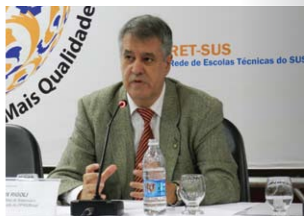
Rígoli: contra a formação ‘McDonald’s’ regulação do Estado

No entanto, duas características diferem de um país para outro: o grau de autonomia do técnico, ou